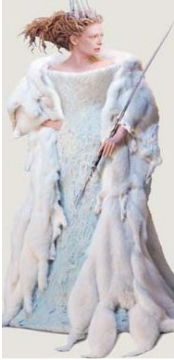
Die weiße Hexe