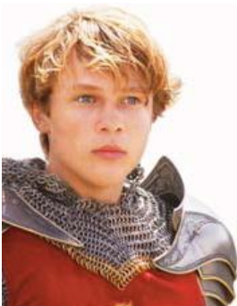
Peter (König Peter, der _____)