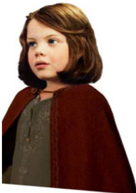
Lucy (Königin Lucy, die _____)