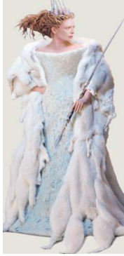
Die weiße Hexe

Beschreibt zum Schluss kurz die Personen, die auf den Bildern zu sehen sind, mit Hilfe deiner Stichpunkte.