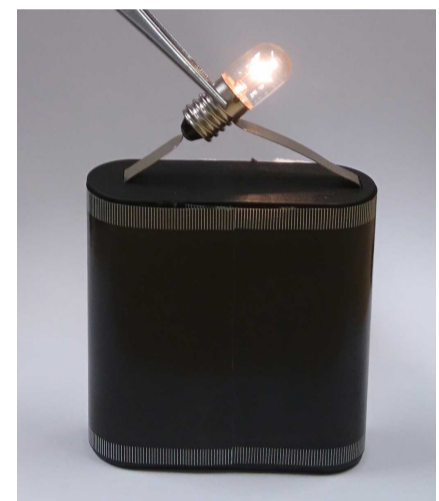
Abb. 1 Stromkreis mit Batterie und Lampe

Berührt hingegen nur ein Kontakt der Glühbirne einen Pol der Batterie, so fließt kein Strom. Du benötigst immer einen geschlossenen Stromkreis.