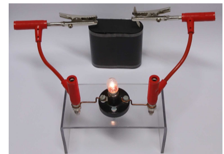
Abb. 2 Stromkreis mit Batterie, Kabeln und Lampe

Willst du die Lampe abschalten, so trennst du z.B. ein Kabel von einem Pol der Batterie ab. Der Stromkreis ist nicht mehr geschlossen, es kann kein Strom mehr fließen und die Lampe erlischt.